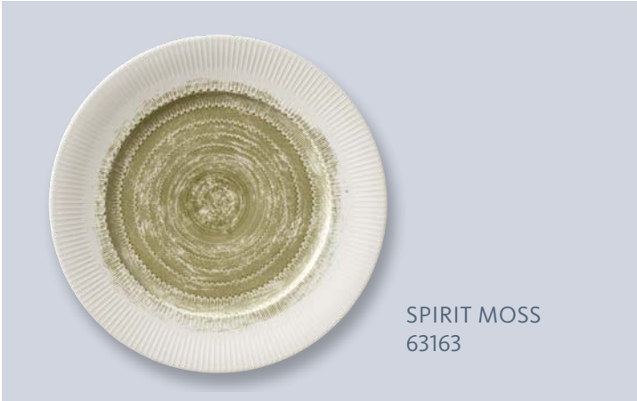
SPIRIT MOSS 63163