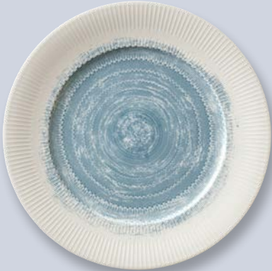
SPIRIT RAIN 63164