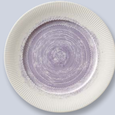
SPIRIT LAVENDER 63173

By affecting our mood in subtle ways, colors play a central part in food presentation. In vogue today are strong, flashy colors coupled with more intimate, quiet hues. The SPIRIT LAVENDER design blends food and decor to an artistic synthesis of color.